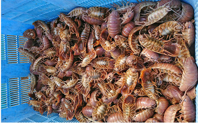
水揚げされたオオグソクムシ

肉食性ですが腐肉食のいわゆる「スカベンジャー」で、主に死んだ魚などを食べ、深海の掃除屋として知られています。オオグソクムシは深海生物ではあるものの、水深や水圧の変化にはかなり強いようで、陸上の水槽内に入れていてもしばらく生きています。