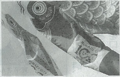
こいのぼりが群泳し、家族連れでにぎわっている ＝狩野川左岸河川敷で